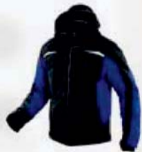
TÉLI SOFTSHELL CIKKSZÁM: 1041 7322-9946