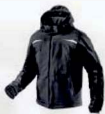
TÉLI SOFTSHELL CIKKSZÁM: 1041 7322-9799