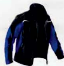
SOFTSHELL CIKKSZÁM: 1241 7322-9946