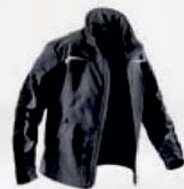
SOFTSHELL CIKKSZÁM: 1241 7322-9799