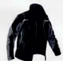
SOFTSHELL CIKKSZÁM: 1241 7322-9997