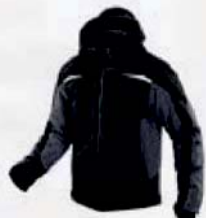
TÉLI SOFTSHELL CIKKSZÁM: 1041 7322-9997